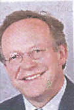
Minister Peder Brekk

Regjeringen har lagt grunnlaget for en framtidsrettet skogpolitikk. Det fortjener våre etterkommere.