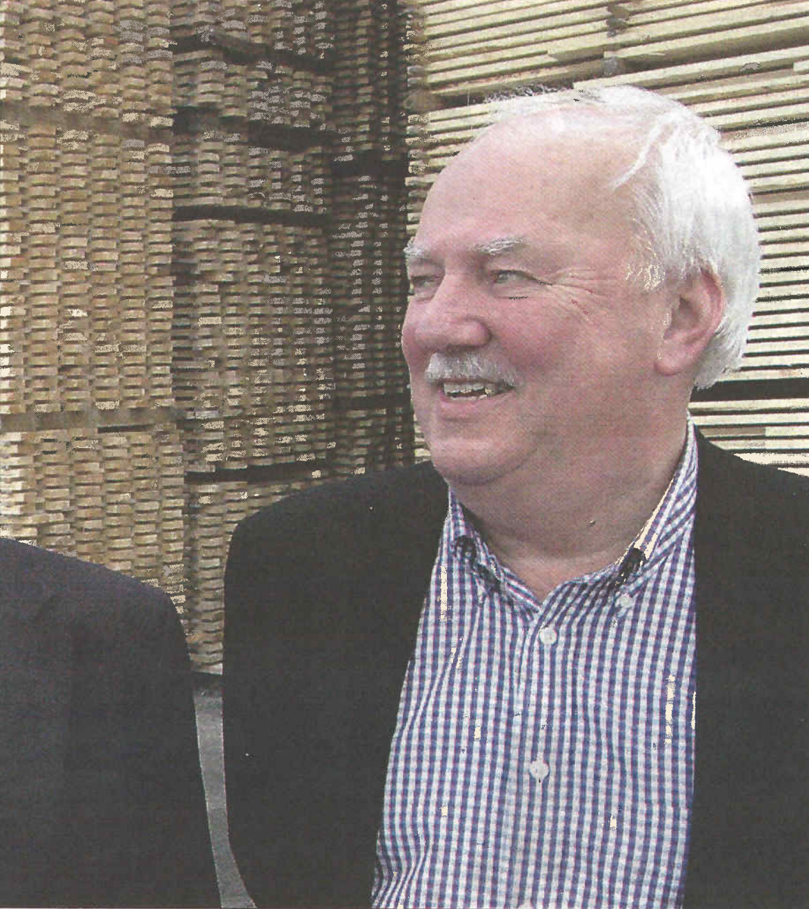
g rimeligste klimatiltak som finnes her i landet er et aktivt skogbruk.